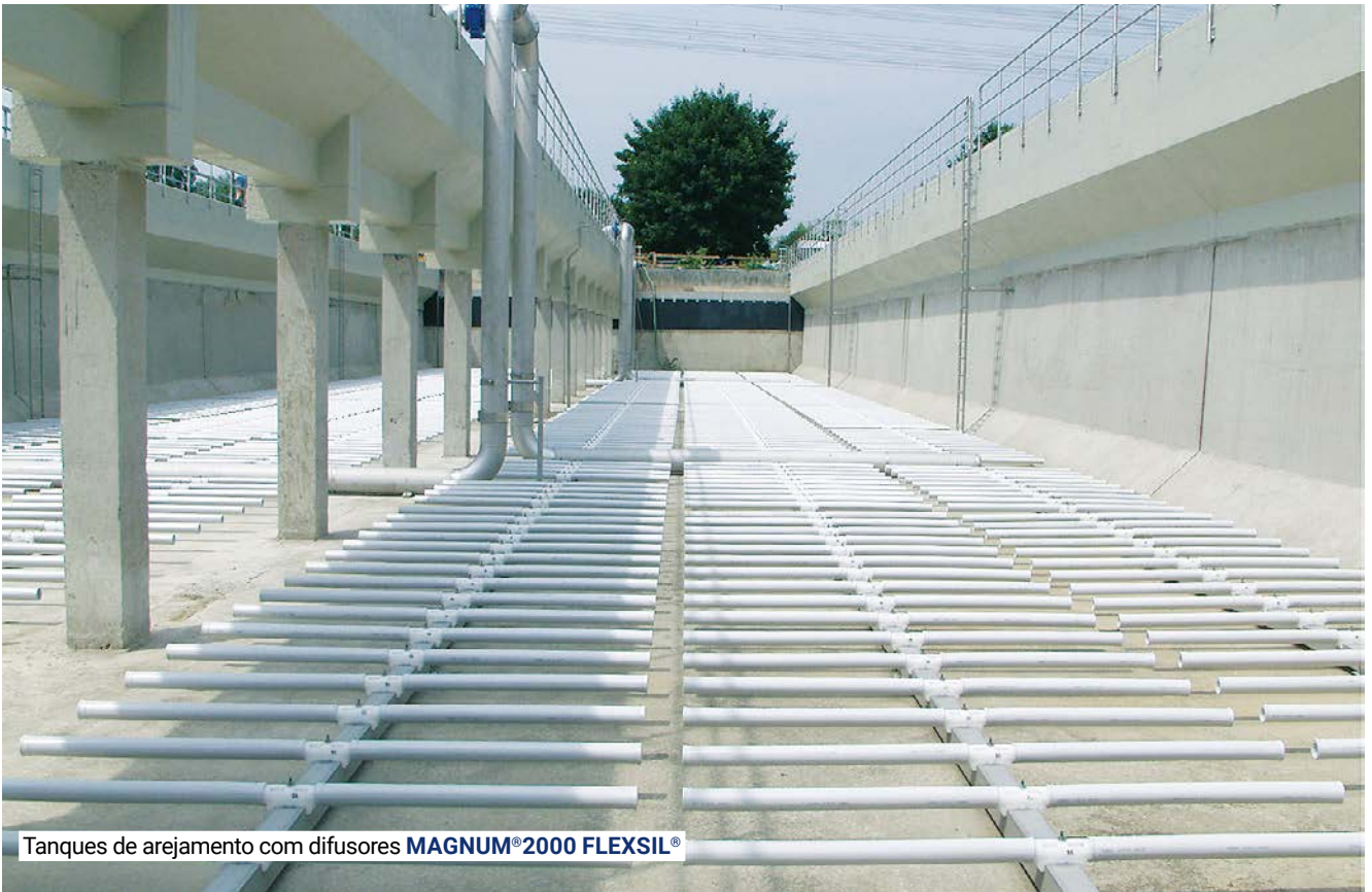
Tanques de arejamento com difusores MAGNUM®2000 FLEXSIL®